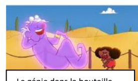
Le génie dans la bouteille