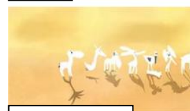
Animal du désert