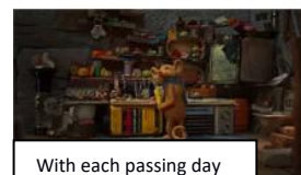
With each passing day