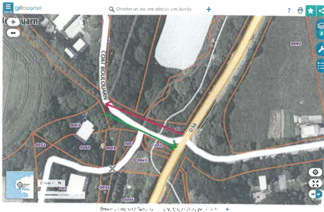
1. Image fournie à titre d'illustration