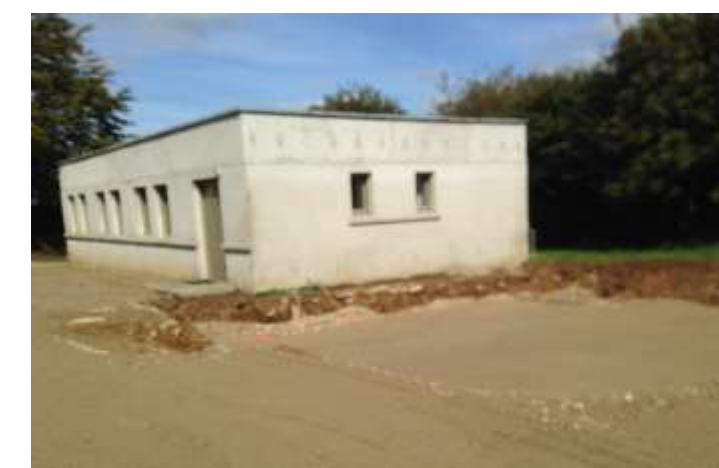
Ancienne salle de sports

Parallèlement, la salle de sports mise à disposition de la section sportive de l'association GUIPRONVEL-ANIMATION , située allée des Lauriers, méritait à la fois une amélioration thermique (isolation insuffisante, chauffage électrique peu performant ...) et de sérieux travaux d'embellissement.