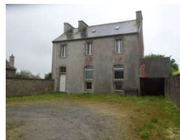
Ancien foyer des jeunes

Le foyer des jeunes de Guipronvel était installé dans une ancienne maison d'habitation située au n°4 route de Milizac. Cet immeuble –qui fut également l'ancienne école communale- ne satisfaisait pas aux normes d'accessibilité (rez-de-chaussée sur 2 niveaux). Surtout, ce bâtiment ancien du bourg ne correspondait plus aux attentes de la jeunesse, notamment en termes de conception et d'image.